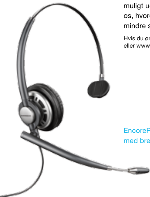
EncorePro™ – slank profil med bredere lydområde

Hvis du ønsker flere oplysninger om Plantronics-produkter, kan du gå ind på www.plantronics.com eller www.ergotel.dk – tlf. 44 35 05 35 – Ergotel A/S er dansk distributør af Plantronics produkter